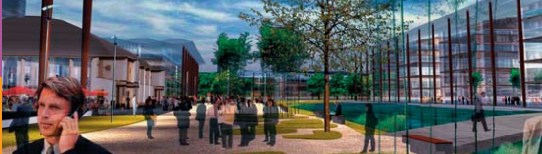
Impressie van Gaiapark in de toekomst

Projectontwikkelaar OVG heeft grootse plannen voor Gaiapark Vijfsluizen. In het bestemmingsplan wordt gesproken over een kantorenlocatie, maar in werkelijkheid gaat het om een modern lifestylepark, dat ook aan omwonenden van alles heeft te bieden. Je kunt er wandelen, sporten, een hapje eten en gebruik maken van allerlei voorzieningen.